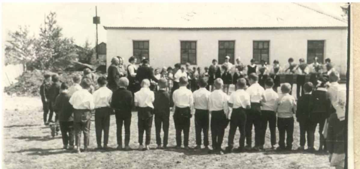
На снимке здание восьмилетней школы.