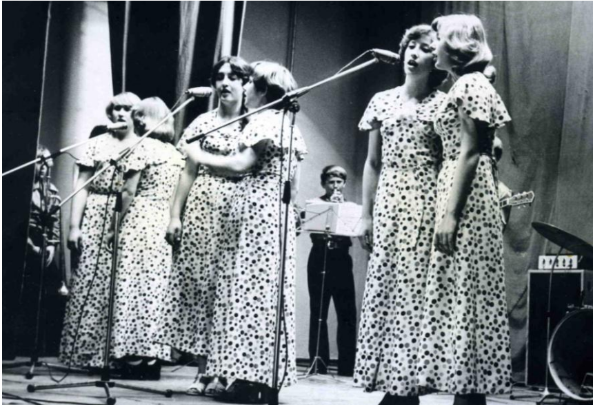
Вокальная группа «Зорянка».