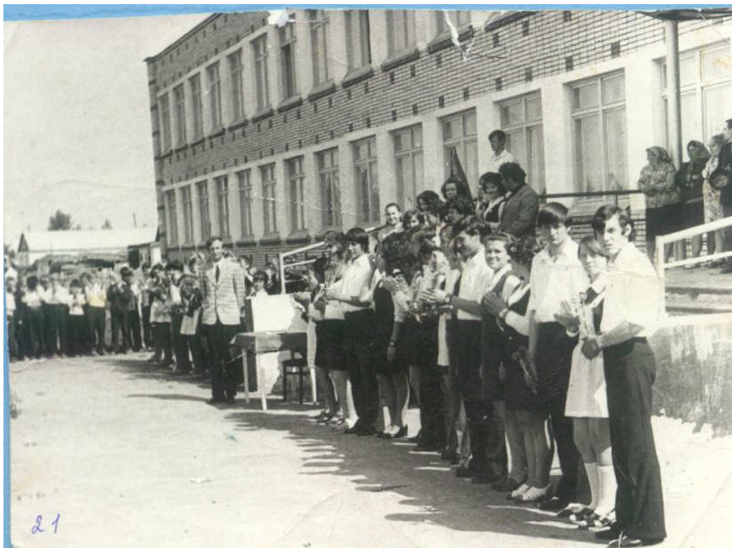
На снимке торжественная линейка, посвященная открытию нового здания школы.

Новое типовое здание школы было сдано в эксплуатацию в 1975 году. В школе была введена кабинетная система. Все 17 кабинетов были оснащены техническими средствами обучения, школьной мебелью. При школе работали интернат, библиотека, мастерские, столовая, актовый зал, физическая и химическая лаборатории, дошкольный участок. В 1986 году создан первый кабинет ИВТ, чуть позже пристроен дискотек.