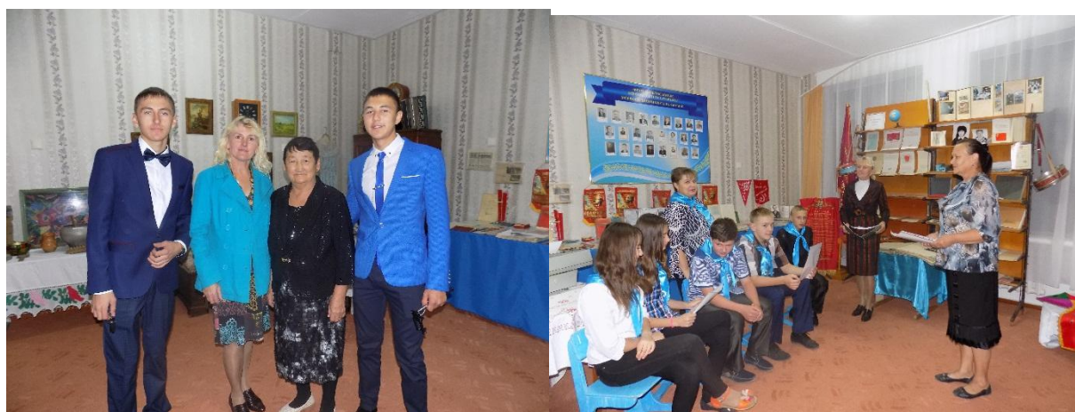
На мероприятиях музея